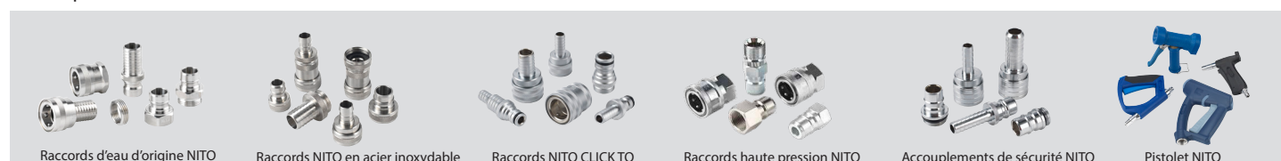
Raccords d'eau d'origine NITO