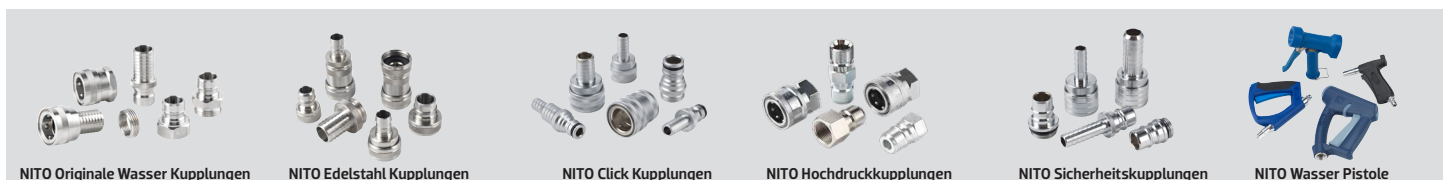
NITO Originale Wasser Kupplungen